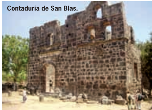
Contaduría de San Blas.